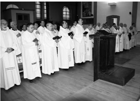
Preveres de Vic a l’església del Prado (Lió)

sament per a la diada: La Festa de la Purificació de Maria i Presentació del Senyor al Temple. Després d’entrar, a través d’un molt ben fet i complet audiovisual, en la vida de Joan Maria Baptista Vianney, cap a la basílica. La missa de la festivitat al poble, comptà amb la presidència del nostre bisbe amb nosaltres com a concelebrants. La celebració començà davant l’església, acaronats per una barreja de sol que començava a eixir i fred intens. L’homilia la féu el vicari episcopal de la diòcesi (en temps del sant rector era la de Lió, ara pertany a la que es creà amb el nom de Belley-Ars) remarcant la consagració especial de preveres i religiosos. Al final de la celebració, aquest mateix mossèn agrai la disponibilitat d’acollida del nostre Bisbat envers els joves del seu que és previst participin de la Jornada Mundial de la Joventut del 2.011 a Madrid; li havia