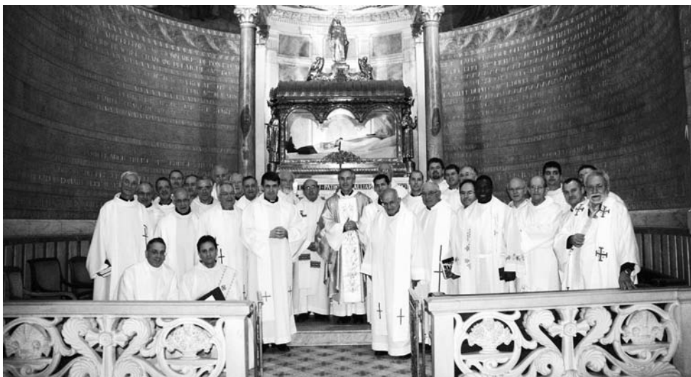
Pelegrims de Vic a Ars, davant la tomba del sant