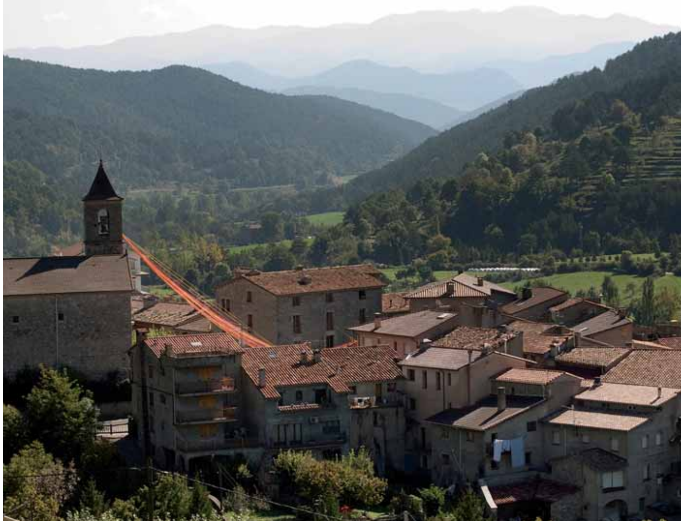
Poble de Gombren. Octubre de 2009.