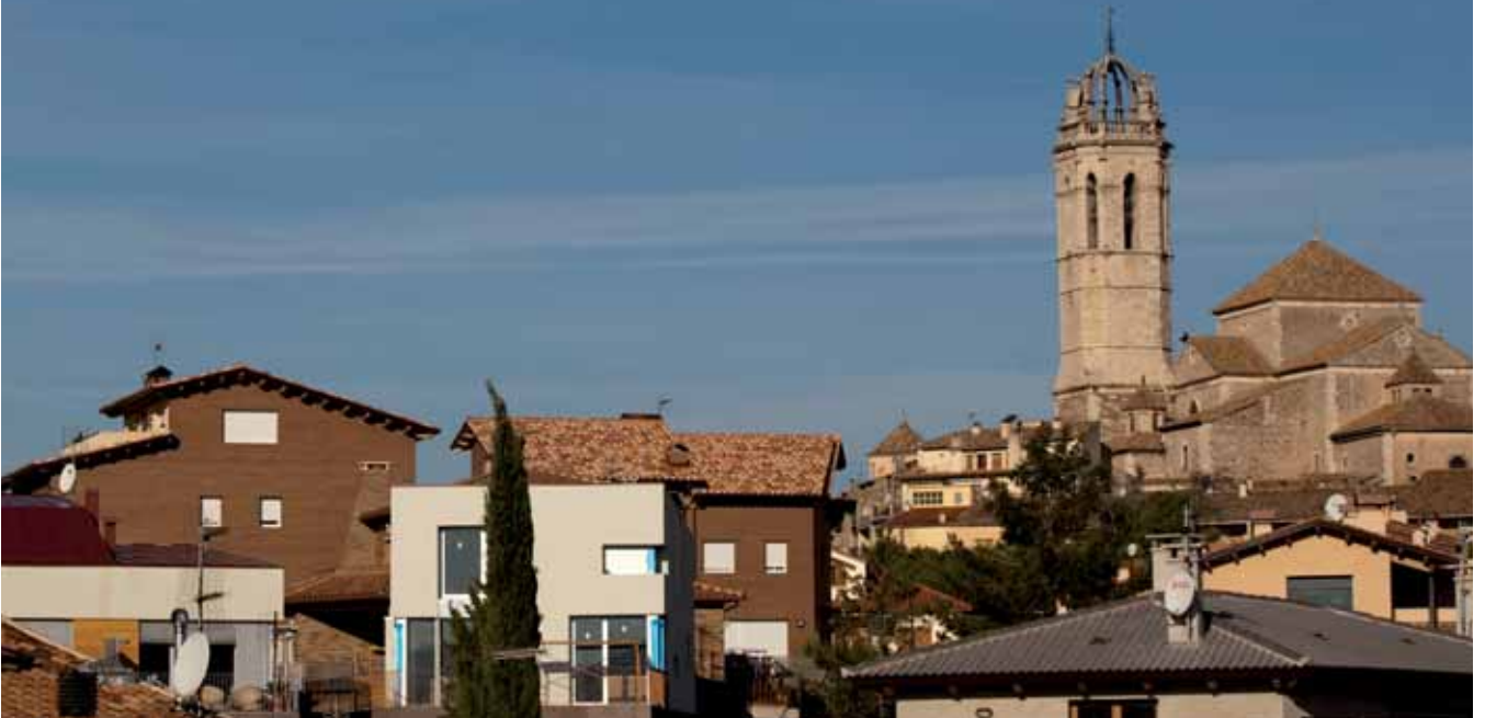
Vila de Moia