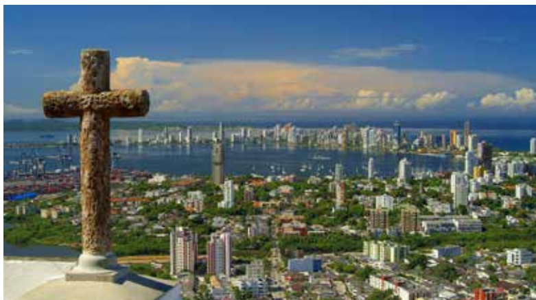
Cartagena de Índies (Colòmbia)

Pere Claver coneixia aquesta penosa realitat, però no tenia mitjans per a impedir-la. Va fer l'única cosa que estava a la seva mà: viure una gran caritat envers els