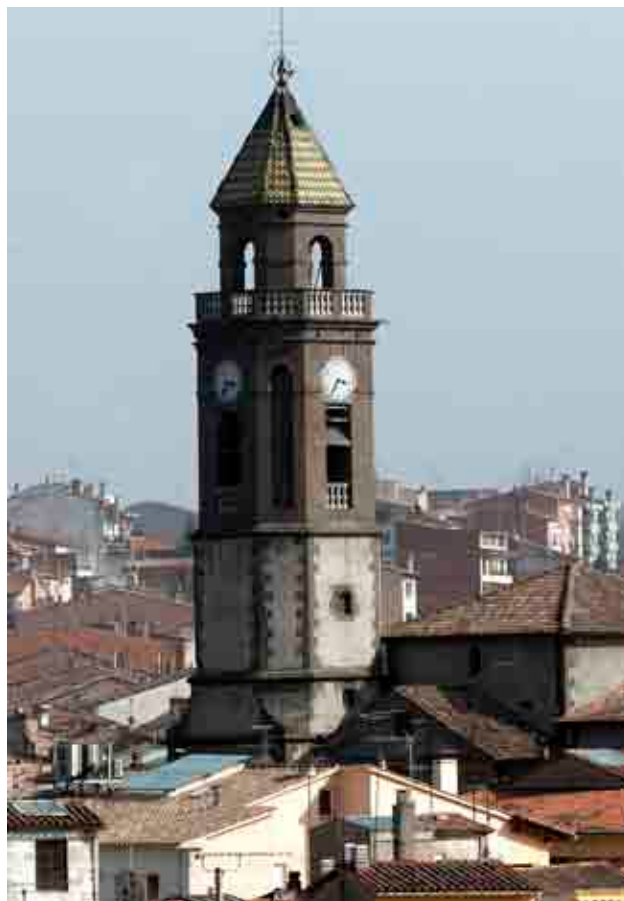
Fotolocal / Oriol Molas / Església de Torelló

He intentat explicar com són les coses. Tant de bo que es tractés amb més respecte el tema dels diners de l'Església; a vegades sembla com si fossin beneficis d'una empresa privada per al gaudi de quatre. L'Església és una entitat amb vocació pública per al servei dels altres i la realitat de la seva labor fins al dia d'avui, amb tot el que estalvia a l'Estat, mereix la seva col·laboració, sigui com fins ara o amb altres sistemes. No és que no es pugui canviar o millorar, però s'agrairia una justificació més enllà dels eslògans i dels tòpics de la intolerància.