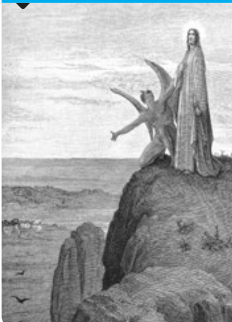
La temptació del diable (1865). Gustave Doré.

Jesús va sentir-se atret a desviar-se de la seva missió. És temptat a satisfer les necessitats materials, a buscar la glòria mundana i el poder i a proposar una religiositat superficial. Jesús, confiant en el Pare, venç la prova afirmant que hi ha uns valors superiors, proclamant la primacia de Déu i renunciant a qualsevol religiositat màgica.