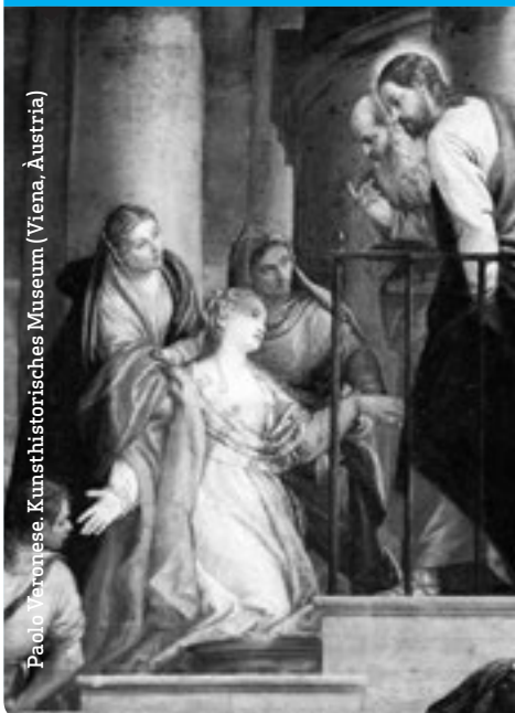
Paolo Veronese, Kunsthistorisches Museum (Viena, Àustria)