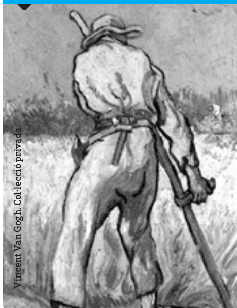
Vincent Van Gogh. Col·lecció privada.