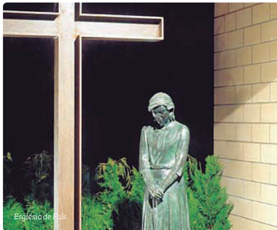
Església de Fals