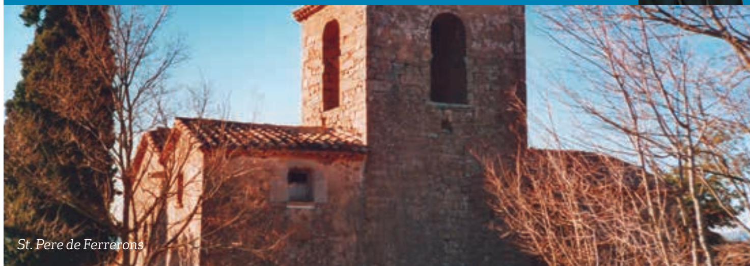
St. Pere de Ferrerons

Segles de cristianisme han fet possible una realitat de cultura cristiana. Una mirada no pas molt profunda, ja ens fa veure signes d'aquesta cultura: festes, celebracions, noms, edificis, institucions, música, art... Negar aquest fet seria negar l'evidència. El sant pare Francesc en Evangelii gaudium reflexiona sobre aquesta realitat valorant-la positivament: «Una mirada de fe sobre la realitat no pot deixar de reconèixer el que sembla l'Esperit Sant. Seria desconfiar de la seva acció lliure i generosa pensar que no hi ha autèntics valors cristians allà on una gran part de la població ha rebut el baptisme i expressa la seva fe i la seva solidaritat fraterna de múltiples maneres... No convé ignorar la tremenda importància que té una cultura marcada per la fe, perquè aquesta cultura evangelitzada, més enllà dels seus límits, té molts més recursos que una mera suma de creients enfront dels combats del secularisme actual... I això s'ha de reconèixer amb una mirada agraïda» (68).