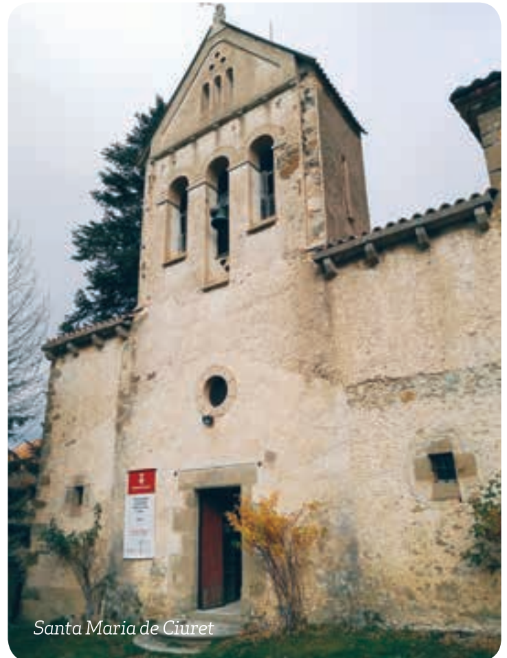
Santa Maria de Ciuret

Santa Maria de Camprodon: s'ha fet una actuació urgent de condicionament de la teulada del campanar, s'ha refet la coberta, intervenció estructural a la paret oest de la nau principal i sanejament de les parts exteriors del tem-