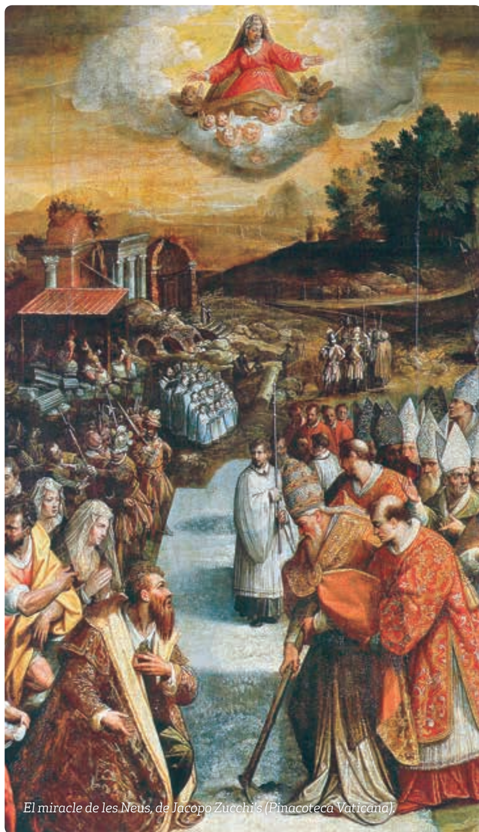
El miracle de les Neus, de Jacopo Zucchi's (Pinacoteca Vaticana).