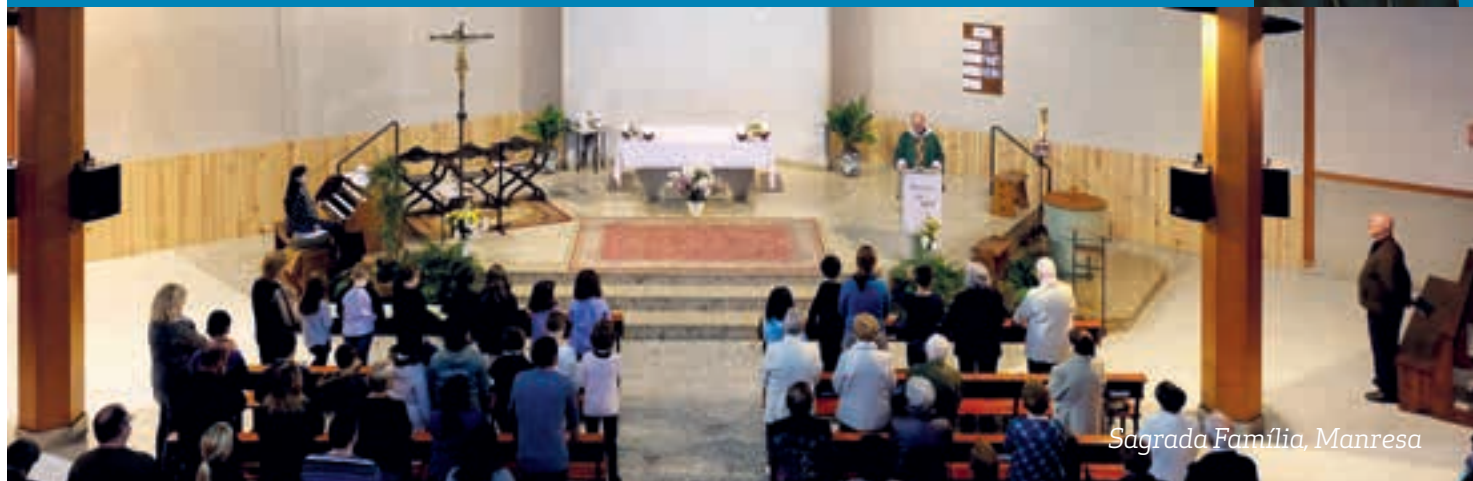
Sagrada Família, Manresa

La parròquia és una comunitat eucarística, el seu centre és l'Eucaristia dominical. La missa o eucaristia és molt més que una reunió on llegim la Paraula de Déu i rebem la sagrada comunió. En l'Eucaristia es fa present la redempció de la humanitat, s'actualitza el misteri pasqual. Celebrar la missa és entrar en la dinàmica de salvació de Déu. El sacrifici de Crist en la creu per a la salvació de la humanitat es renova, encara que de manera incruenta, en la celebració eucarística. Crist ressuscitat, donant-nos la seva vida, es fa present enmig dels qui celebren el seu misteri pasqual. La celebració de l'Eucaristia dominical és una necessitat per a les comunitats cristianes. Recordem el testimoniatge dels màrtirs de Bitínia, en el segle III, detinguts i morts per reunir-se a celebrar l'Eucaristia el diumenge. Ells manifestaren que el diumenge no es pot interrompre; diumenge rere diumenge l'Església i els cristians celebren l'Eucaristia. I també digueren: «Sense el diumenge no som res.»